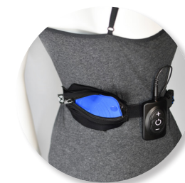
DOR NAS COSTAS (PNS) N. SUP. CLUNEAL