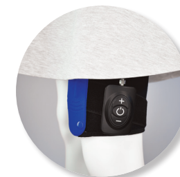
DOR NO JOELHO N. GENICULAR/N. SAFENO