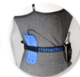
DOR NAS COSTAS (SCS) T8-T9