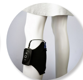
DOR NO PÉ/TORNOZELO N. TIBIAL